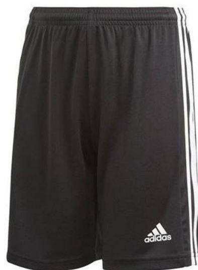
1 short da allenamento

Consigliamo di far indossare ai bimbi scarpe da calcetto indoor senza tacchetti o scarpe da ginnastica