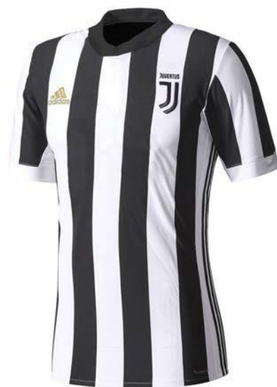
1 t-shirt da allenamento